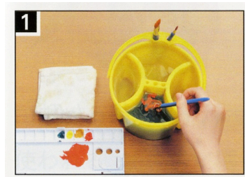
「美術 1 44-2」