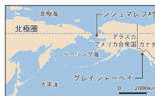
「国語 3 ③ 195-2」