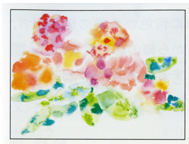
「美術 1 44-2」